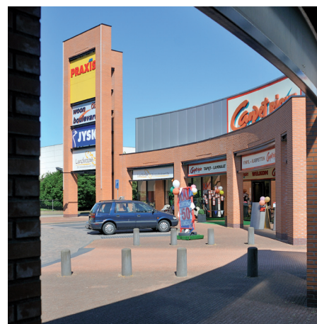
Detailhandel kan in Oss goed terecht: in het stadscentrum én op de woonboulevard.