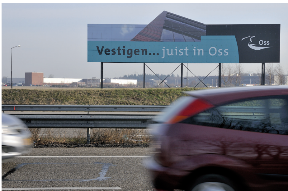
Bedrijventerrein Vorstengrafdonk, direct aan de snelweg A50/A59, is het visitekaartje van Oss.

MULTIMODAAL OSS HEEFT BEDRIJVEN VEEL TE BIEDEN!