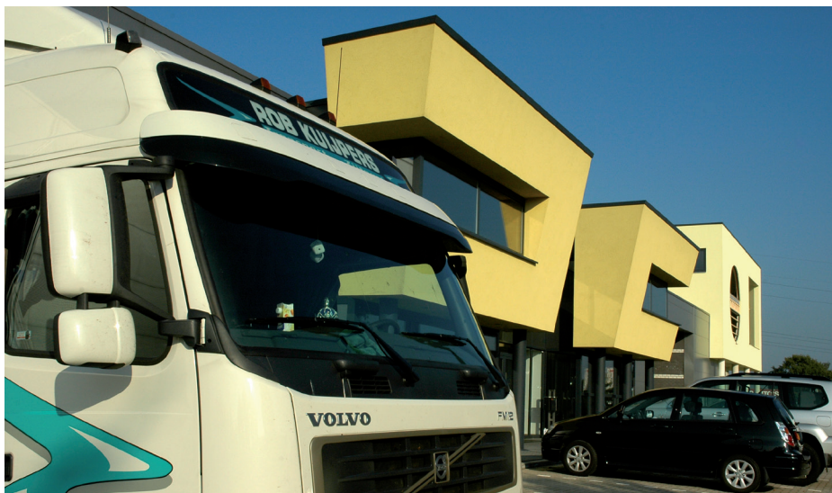
Bestaande en nieuwe bedrijventerreinen in de gemeente Oss bieden kwalitatief goede mogelijkheden voor bedrijfsvestiging.

bedrijventerrein ligt aan de haven van Oss met een directe verbinding naar de Maas. Op een steenworp afstand - op bedrijventerrein De Geer - is nog zo'n 12 ha bedrijfsgrond beschikbaar, amper een halve kilometer van haven en goederenspoor. Met als extra mogelijkheid gebruik te maken van verlading van en naar containerschepen via de Osse Overslag Centrale. Ontsluiting van Elzenburg richting snelweg A50/A59 gaat via de N329. Na ombouw naar 'Weg van de Toekomst' met vier rijstroken binnenkort een nog snellere verbinding met het nationale wegennet.