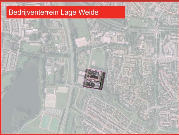
Bedrijventerrein Lage Weide