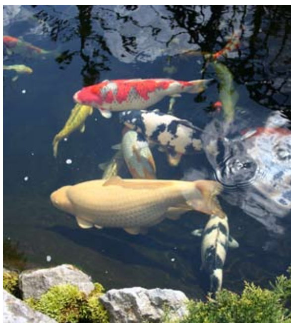
LINKS: Dat de waterkwaliteit top is, is aan de Koi te zien.

Camping De Midden Veluwe Palmenhuizerweg 1 6732 EH Harskamp <<