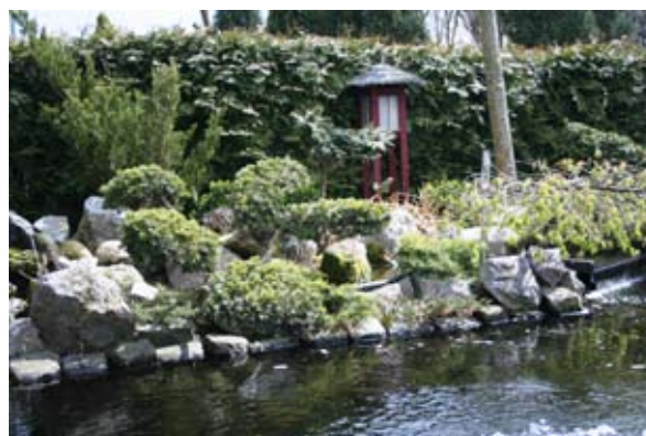
BOVEN: De vijver van JAVI is al jaren onder- handen van Henk.

aantal bijzondere mineralen die geen van allen chemisch zijn gemanipuleerd maar alleen zijn behandeld met een vitaliser. Alles “puur natuur” dus. Het filtermedium kan in elk systeem worden aangebracht. Omdat het filtermateriaal zeer fijn is, moet het in een daarop aangepaste behuizing worden geplaatst. Denk hierbij aan een heel fijn- mazig net o.i.d. Ook mag deze verpakking de doorstroming niet belemmeren en moet het in elk filter kunnen worden geplaatst. De zelfreinigende wegberm reinigt vuil wegwater direct in de berm door middel van een filterconstructie en gebruikt dit filter als fundering voor een drainerende en waterbergende wegbermverharding van bermver- band blokken. Als wij onze vijvers spoelen, komt het afvalwater ook in het milieu terecht. Als dit >>