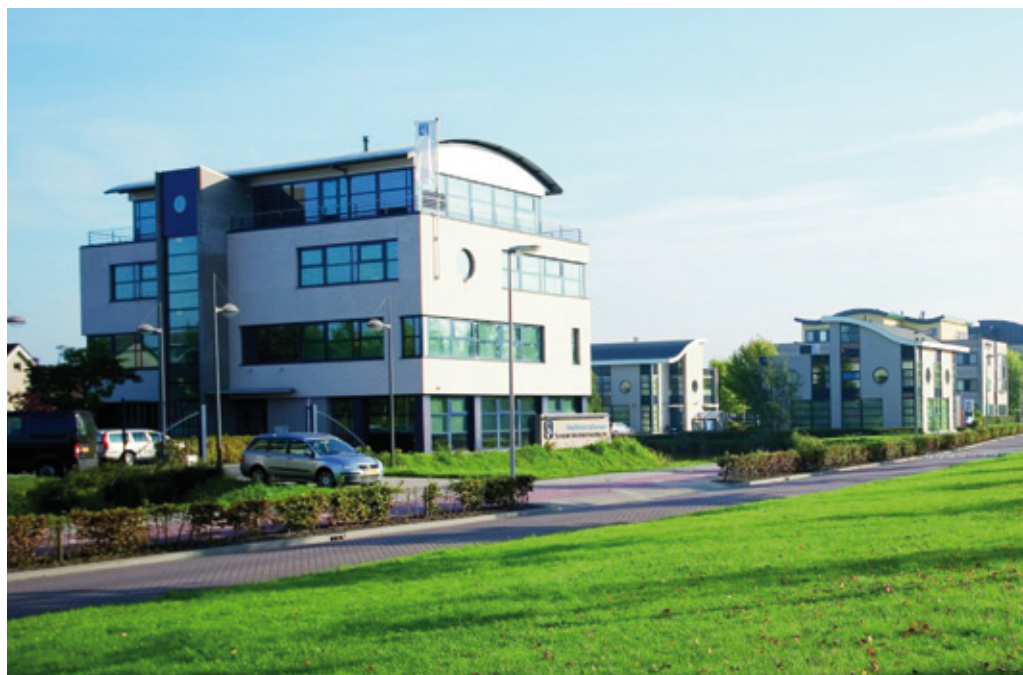
Kantoorpanden aan de Parklaan

Nu is Vosdonk gerevitaliseerd: groen, wijs, goed bereikbaar, veilig en vriendelijk. De gemeente pakte de infrastructuur en het openbaar gebied aan, de bedrijven zelf knapten hun eigen panden en terreinen op. Beide sloegen de handen ineen om gezamenlijk deze facelift van de grond te krijgen. Wie over het bedrijventerrein rijdt zou niet de indruk krijgen dat het terrein al meer dan vijftig jaar oud is.