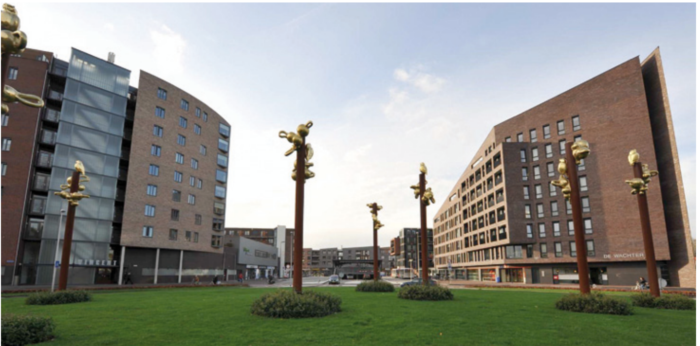
Winkelcentrum met parkeergarage

Vosdonk is ook veilig, de stichting Surveillance Vosdonk zorgt door het toezicht op het terrein dat het aantal inbraken beperkt blijft. Daarnaast heeft Vosdonk sinds 2008 het keurmerk Veilig Ondernemen, een predicaat voor een sociaal en fysiek veilige omgeving voor ondernemers. Samen zetten de gemeente en ondernemers zich in om criminaliteit, overlast en verloedering tegen te gaan.