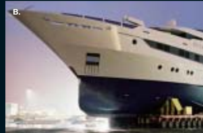
A. LOAD-OUT VAN TERMINAL (10.200 TON), (M.B.V. SPMTs + BALLAST SYSTEEM) B. TRANSPORT JACHT