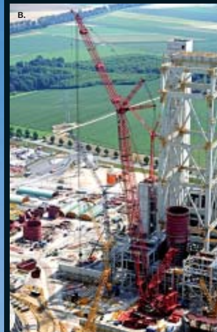
A. TRANSPORT EN INSTALLEREN GENERATOR B. BOUWEN VAN EEN ENERGIECENTRALE (M.B.V. PTC-DS)