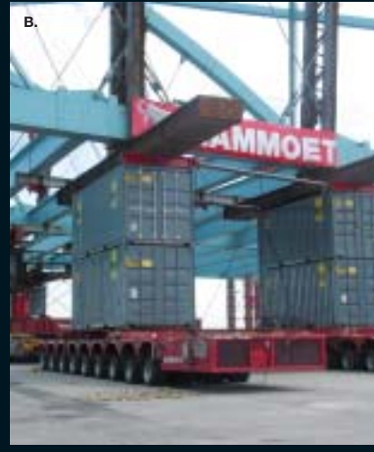
A. + B. TRANSPORT EN INSTALLEREN VAN EEN BRUG (125 METER LANG, 50 METER BREED, 2.500 TON)