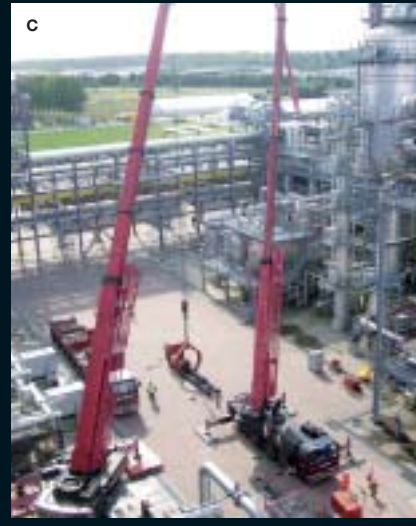
A. OVEREIND ZETTEN EN PLAATSEN VAN EEN REACTOR (500 TON), D.M.V. GANTRY SYSTEEM B. HIJSEN EN INSTALLEREN VAN EEN REGENERATOR (880 TON) C. PLANT STOP